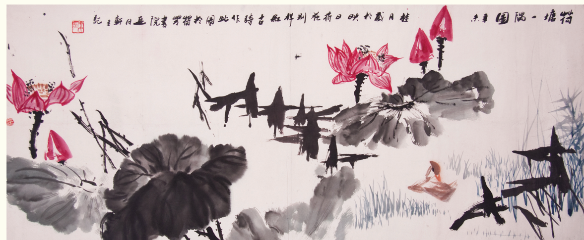
荷塘一隅 · 张天龙 作

12月15日下午，在中国民主建国会第十一次全国代表大会召开期间，民建淮安市委与民建安顺市委在北京会议中心举行结对共建签约仪式并召开座谈交流会议。