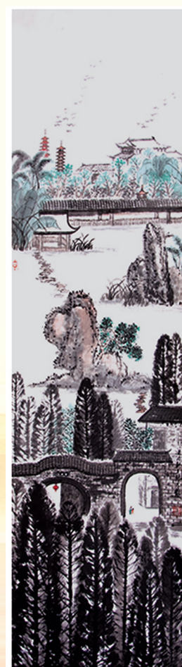
春色满园 · 张天龙 作