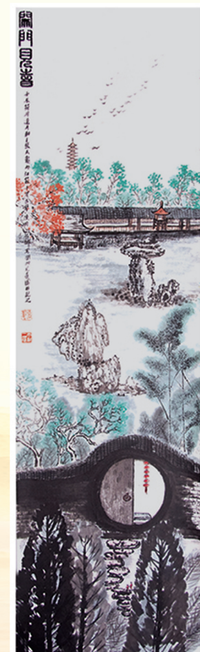
开门见喜幽篁发 · 张天龙 作